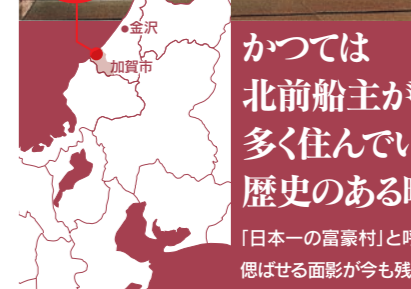
石川県加賀市 橋立

かつては北前船主が多く住んでいた歴史のある町。「日本一の富豪村」と呼ばれた当時を偲ばせる面影が今も残っています。