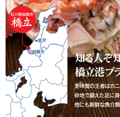
石川県加賀市 橋立

知る人ぞ知る 橋立港ブランドの魚たち。 冬味賞の王者はカニ。 砂地で鍛えた足に身がびっしり詰まってるうまいとか。 他にも新鮮な魚介類が自慢です。